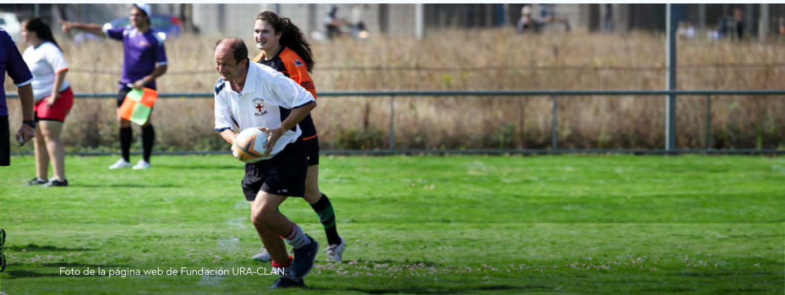
Foto de la página web de Fundación URA-CLAN.

Es decir, desarrollan un proyecto deportivo con aspiración a generar impactos o cambios a nivel social: