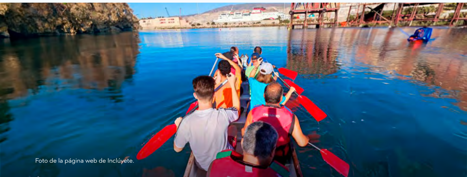
Foto de la página web de Inclúyete.

Se trata de un programa gratuito, financiado por FAISEM, que pretende fomentar el piragüismo entre personas con y sin problemas de salud mental, así como reducir el estigma social hacia este tipo de personas.